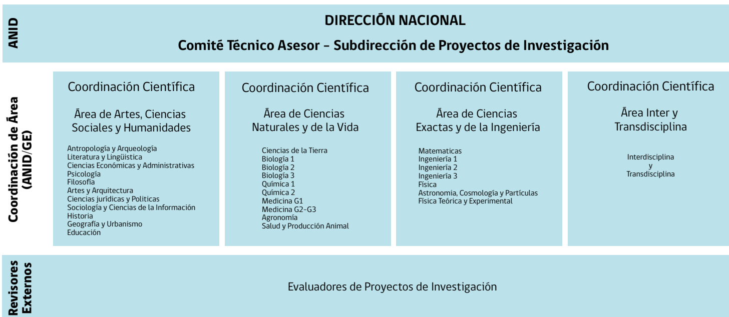
Figura N° 2: Estructura funcional Subdirección de Proyectos de Investigación